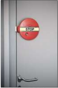
Montage auf dem Türblatt

Mehr Bilder zu "Fluchttürsicherung -DEXCON-, Elektrischer Alarm für Türen und Fenster, DIN EN 179/1125"